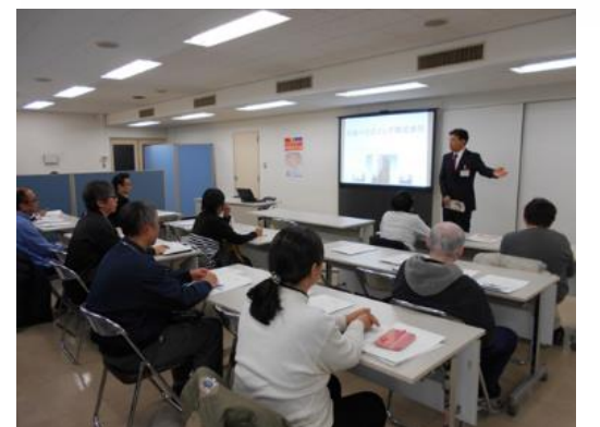
企業のプレゼンに聞き入る参加者の皆さま

さーくるでは、今後も生活困窮者自立支援事業の一環として、企業と求職者の出会いの場を作り「生きがいをもって働く！」を応援していきたいと思っています。