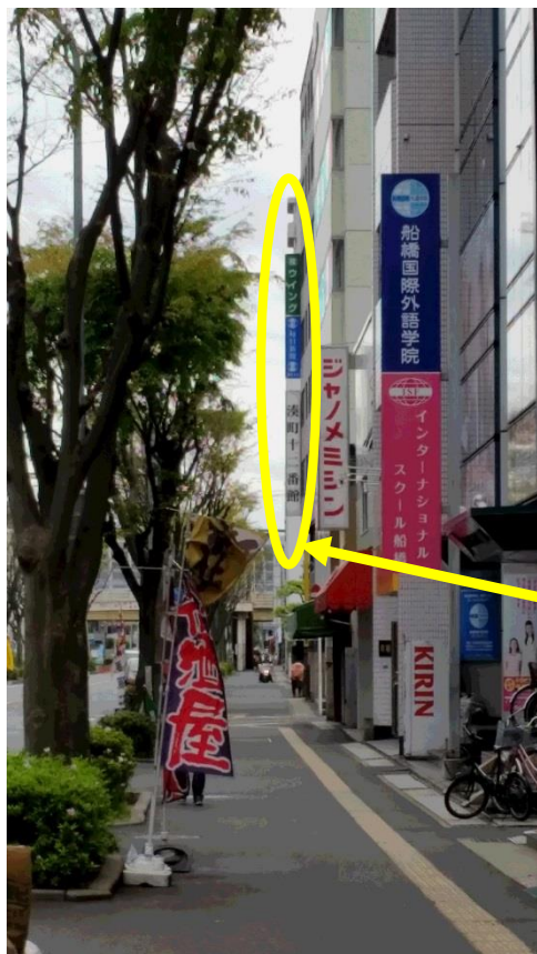
生活支援課から見た建物位置