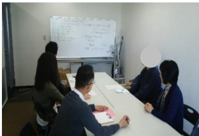
↑OB会で職場での体験などを話し合っています。